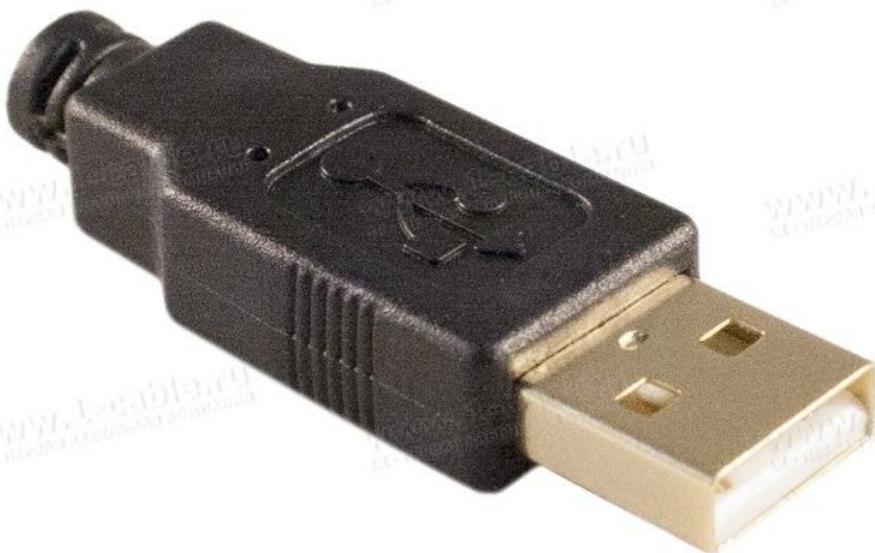
Так выглядит коннектор мыши